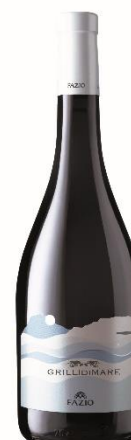
Grilli di Mare Grillo D.O.C. Erice