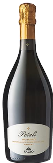
Petali Moscato DOC Erice