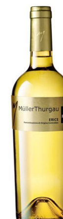
Muller Thurgau Erice D.O.C.