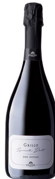
Grillo Spumante Brut DOC Sicilia