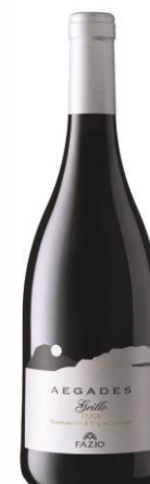
Aegades Grillo - D.O.C. Erice