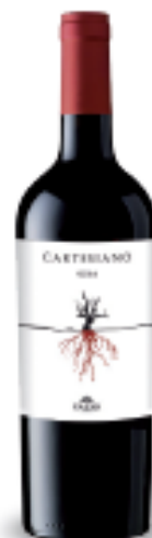
Cartesiano Rosso IGT Terre Siciliane