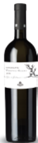
Trenta Salmi Catarratto fermentato in barrique