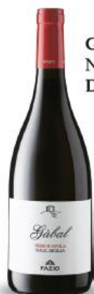
Gabal Nero d'Avola DOC Sicilia