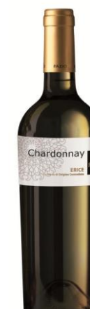
Chardonnay Erice D.O.C.