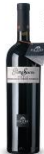
PietraSacra Rosso Riserva - DOC Erice