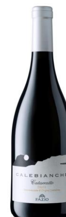
Calebianche Catarratto - D.O.C. Erice