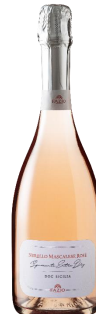
Nerello Mascalese Rosè Spumante Extra Dry DOC Sicilia